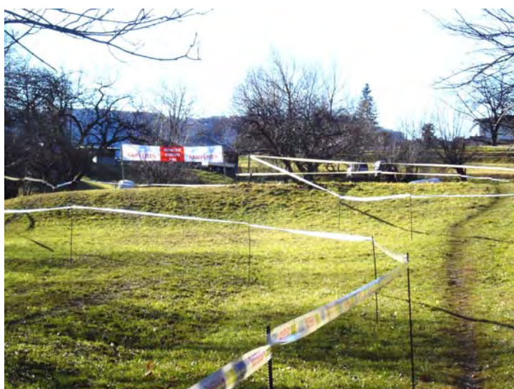
Nella foto: la parte finale del tracciato capriaschese.